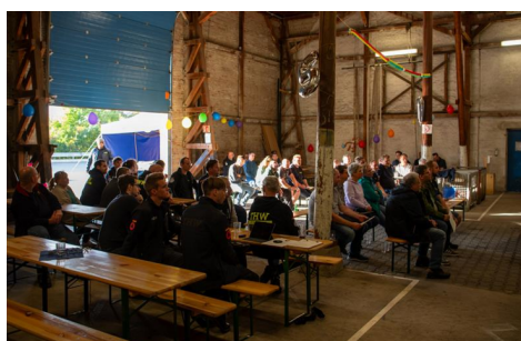
Mitgliederversammlung des Fördervereins mit anschließender 75-Jahr Feier des THW