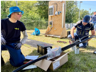
Übung mit dem OV Buxtehude: Muffen gießen