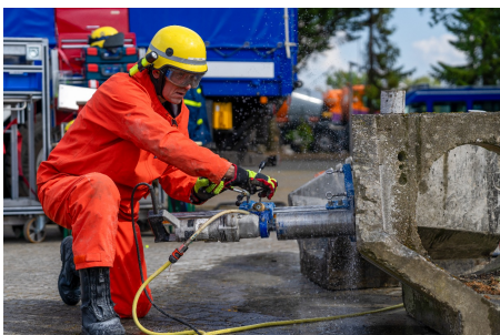
Kernbohrgerät – 60-Jahr Feier OV Lüchow-Dannenberg

Traditionell ließen wir das Jahr bei der gemeinsamen Weihnachtsfeier ausklingen. Zusammen mit der Fachgruppe Notversorgung/Notinstandsetzung stand das kameradschaftliche Miteinander im Mittelpunkt. In geselliger Runde blickten wir auf ein intensives, ausbildungsreiches und erfolgreiches Jahr 2025 zurück.