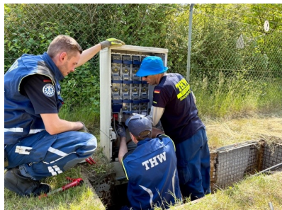
Übung mit dem OV Buxtehude: Hausanschlüsse an Erdleitung

Wir wünsche ihr für ihr Studium in Süddeutschland alles Gute und viel Erfolg. Die Gruppe steht mit einer Stärke von 0/2/11//13 sehr gut da.