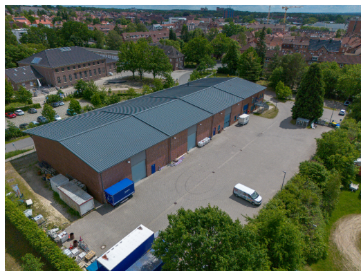
Aktuelle Ansicht des OV: Nordseite