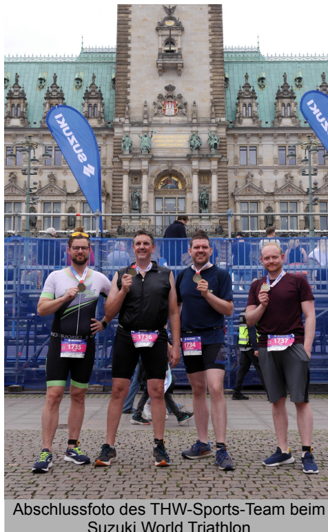
Abschlussfoto des THW-Sports-Team beim Suzuki World Triathlon