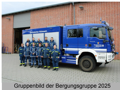
Gruppenbild der Bergungsgruppe 2025

Im Rahmen der Öffentlichkeitsarbeit war die Bergungsgruppe auch in diesem Jahr auf den Festen verschiedener Feuerwehren im Landkreis Lüneburg vertreten und unterstützte das Osterfeuer der Feuerwehr Oedeme mit Strom und Beleuchtung. Insbesondere war die Bergungsgruppe auch beim Katastrophenschutztag am 27.09.2025 in Embsen vertreten, wo sich international mit Kameraden polnischer und niederländischer Feuerwehren ausgetauscht wurde. Auch der TH-Lehrgang der Kreisfeuerwehr wurde wieder tatkräftig unterstützt und an je einem Abend pro Lehrgang der Aufbau einer Wandabstützung mit dem Einsatzgerüstsystem (EGS) an die Kameradinnen und Kameraden der Feuerwehr vermittelt. Eine besondere Herausforderung, der sich die Bergungsgruppe gern stellt, ist das neue Handbuch zum Umgang mit der persönlichen Schutzausstattung gegen Absturz und zum einfachen Retten aus Höhen und Tiefen. Das so neu erworbene Wissen wurde direkt beim Aufbau eines Übungsturmes mit dem EGS praktisch angewendet und an dem Turm an mehreren Dienstabenden auch das Retten verunglückter Personen geübt.