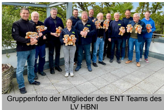
Gruppenfoto der Mitglieder des ENT Teams des LV HBNI