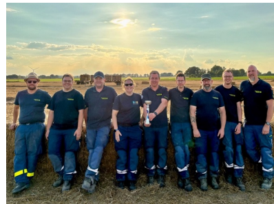
Abschlussfoto beim 24h Rollerrennen