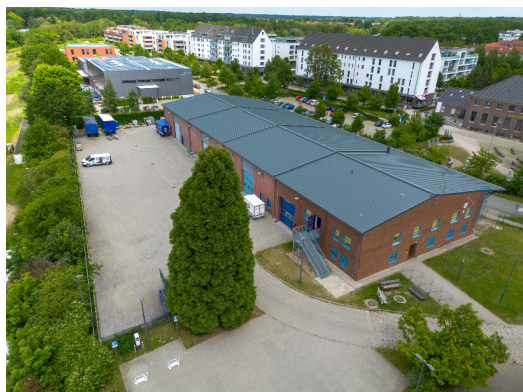
Aktuelle Ansicht des OV: Südseite

Insgesamt war 2025 für die Liegenschaft somit kein Jahr spektakulärer Bauvorhaben, wohl aber eines mit mehreren wichtigen Verbesserungen im Detail. Die höhere Reinigungsqualität, die Neuordnung der Hallenstellplätze und die kontinuierliche Instandhaltung haben die Bedingungen im Alltag verbessert. Gleichzeitig sorgt die Entscheidung zum bundesweiten THW-Bauprogramm für berechtigte Hoffnung, dass die seit Jahren bestehende Raumnot perspektivisch überwunden werden kann. So endet das Jahr trotz aller Herausforderungen mit einem insgesamt positiven Ausblick auf die zukünftige Entwicklung des Ortsverbandes.