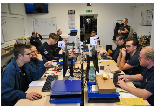
LuK-OV Einsatzstab bei einer Übung