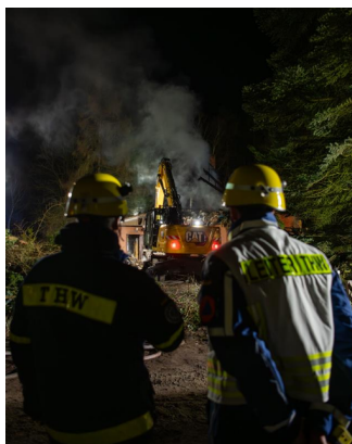
Einsatz des Ztr TZ bei einem Beleuchtungseinsatz