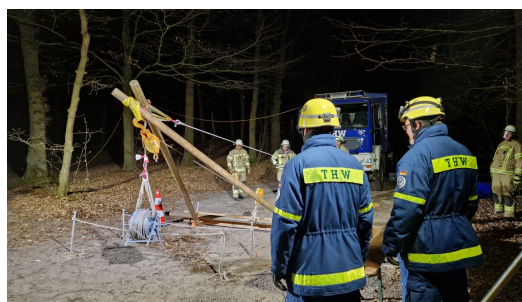
Mastkran-Station beim Nachtmarsch Westergellersen